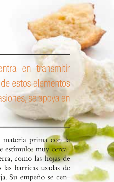
El helado en dellaSera.

noce perfectamente la materia prima con la que trabaja y se sirve de estímulos muy cercanos, propios de esta tierra, como las hojas de la higuera, la racima o las barricas usadas de las bodegas de La Rioja. Su empeño se centra en transmitir emociones a través de estos elementos y, en numerosas ocasiones, se apoya en los recuerdos. Cada ingrediente cuenta una historia y es inmenso el orgullo que siente al saber que sus clientes sienten que retroceden a los meses estivales de su infancia en el pueblo gracias al aroma que desprende su helado de